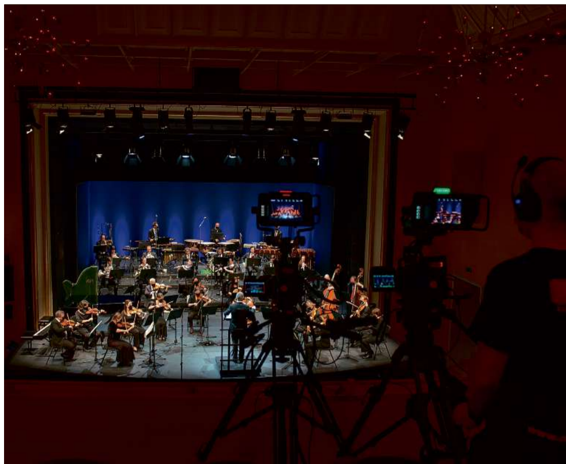
Orchesterklänge für daheim: Die Kammerphilharmonie Graubünden «sendet» aus dem Theater Chur.